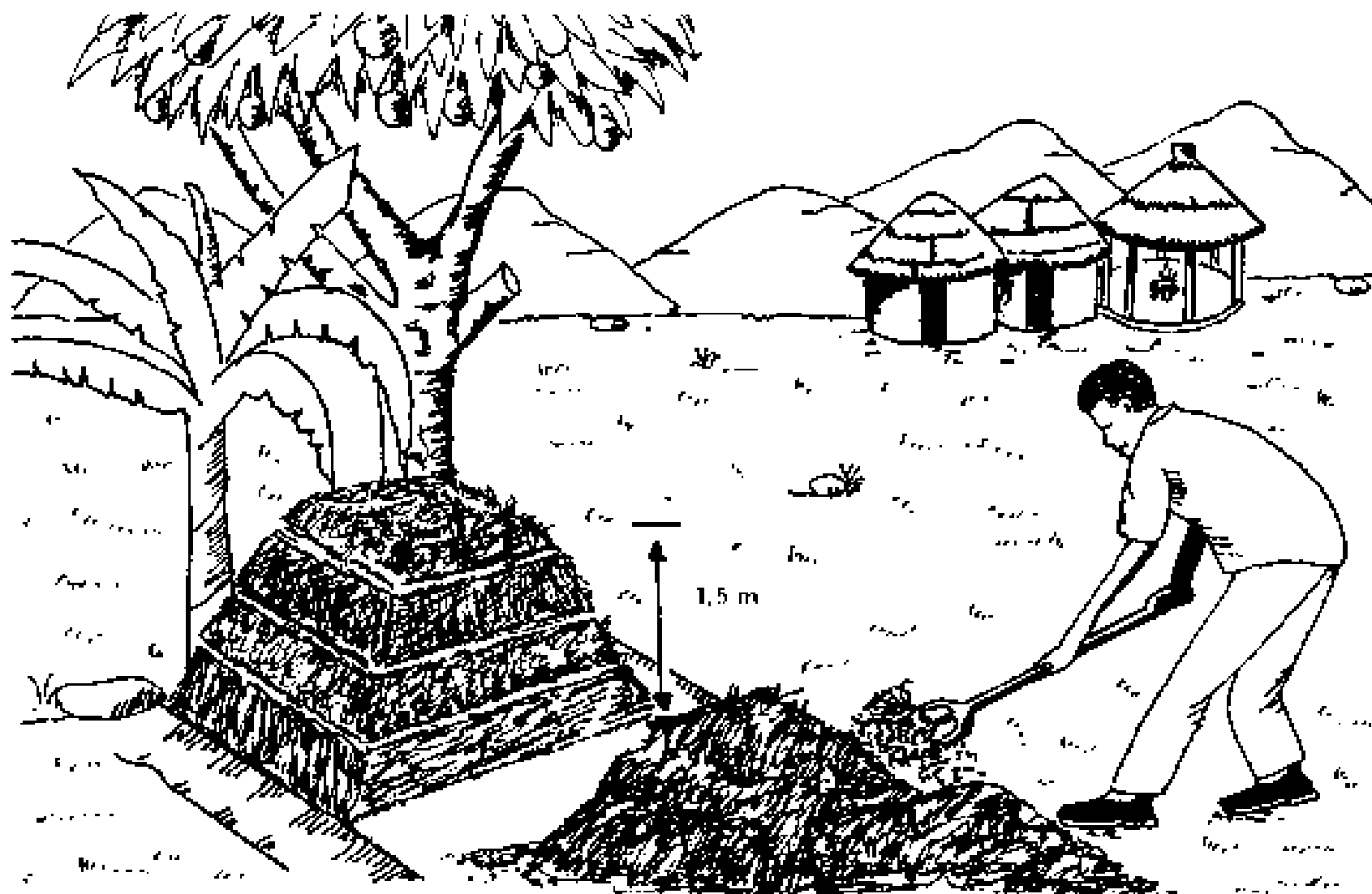
Horticultura em MPB