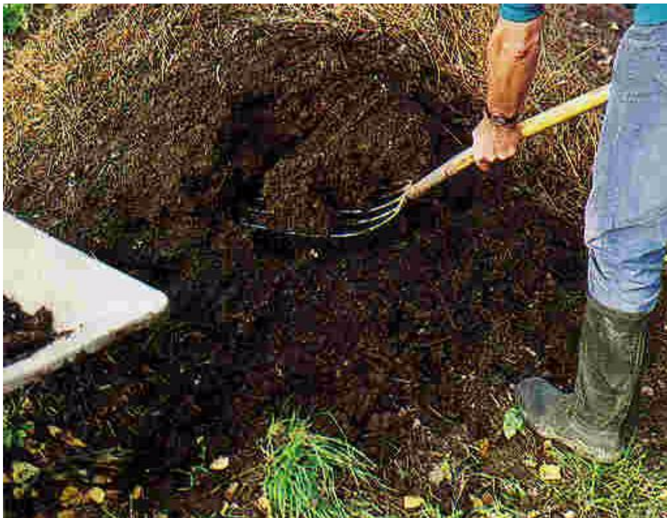
Horticultura em MPB