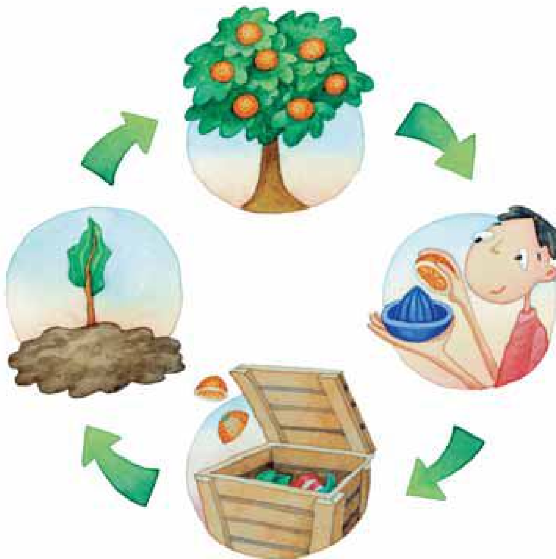
Horticultura em MPB