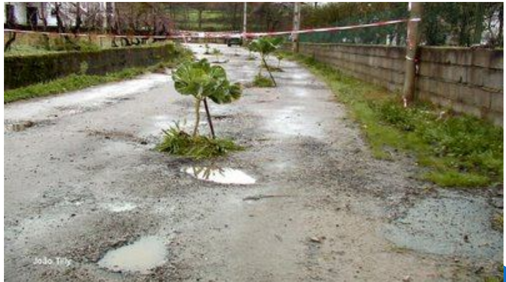
Horticultura em MPB